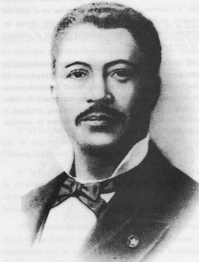
General Gregorio Luperón. Foto poco conocida.