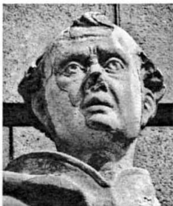
Fray Bernat Boil, O.M.

que desdibuja un poco cualquiera de sus retratos. Gracias a su habilidad, y probablemente por descender de familia de la nobleza, en 1479, cuando aún no había recibido las órdenes mayores, empieza a actuar de secretario de Fernando el Católico, y fue enviado como agente suyo a negociar los territorios perdidos en el Roussillon o Rosilló y la Cerdanya.