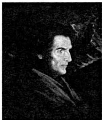
José de Acosta, S.J.

El P. José de Acosta Porres, misionero, naturalista e historiador, futuro autor de la Historia Natural y Moral de las Indias (Sevilla, 1590), había nacido en Medina del Campo (Valladolid) el 9 de octubre de 1540 y estudió en el Colegio que la Compañía tenía en aquella ciudad tan ligada a Isabel de Castilla. A pesar de tener sólo doce años, fue admitido como novicio en Salamanca el 10 de septiembre de 1552, aunque sólo permaneció un mes, y fue enviado a su ciudad natal, y al que había sido su colegio, hasta que hizo los votos el 1º de noviembre de 1554, teniendo ya catorce años. Estudió Filosofía en centros de tanto prestigio como Coimbra y Alcalá de Henares, y Teología en esta última universidad (1559-1563). Ordenado en 1567, empezó a enseñar Teología en los colegios de Ocaña (1568-1569) y Plasencia (1569-1571), hasta que en ese año S. Francisco de Borja, accediendo a su deseo, le destinó al Perú. Como procurador, se embarcó con dos compañeros más el 15 de mayo de ese año. 2 Y es precisamente entonces cuando se ve obligado a quedarse cuatro meses en Santo Domingo, cuando los jesuitas no habían logrado establecerse aún, y sólo de vez en cuando alguno como él se detenía en una especie de escala técnica. Después de una exitosa labor intelectual y pastoral, regresó a España y falleció en Salamanca el 15 de febrero de 1600. 3