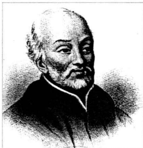
Pierre François-Xavier de Charlevoix, S.J.

le recordaría mucho después como “un buen conversador”. 1 Había hecho su profesión solemne en Orléans (Loire, Francia) el 2 de febrero de 1716. A partir de entonces también comienza su carrera de escritor, la que le daría fama, y su primer trabajo fue la revisión y ampliación de una historia del Japón, escrita en 1689 por el también jesuita Jean Crasset.