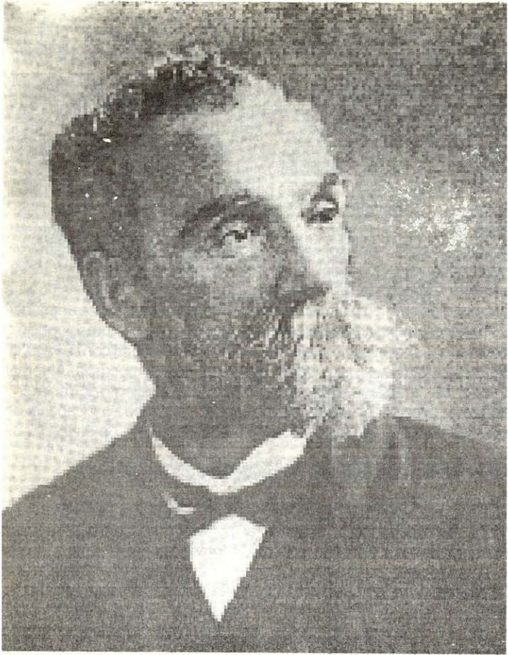
Eugenio María de Hostos